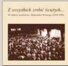
Z wszystkich zrobić świętych...