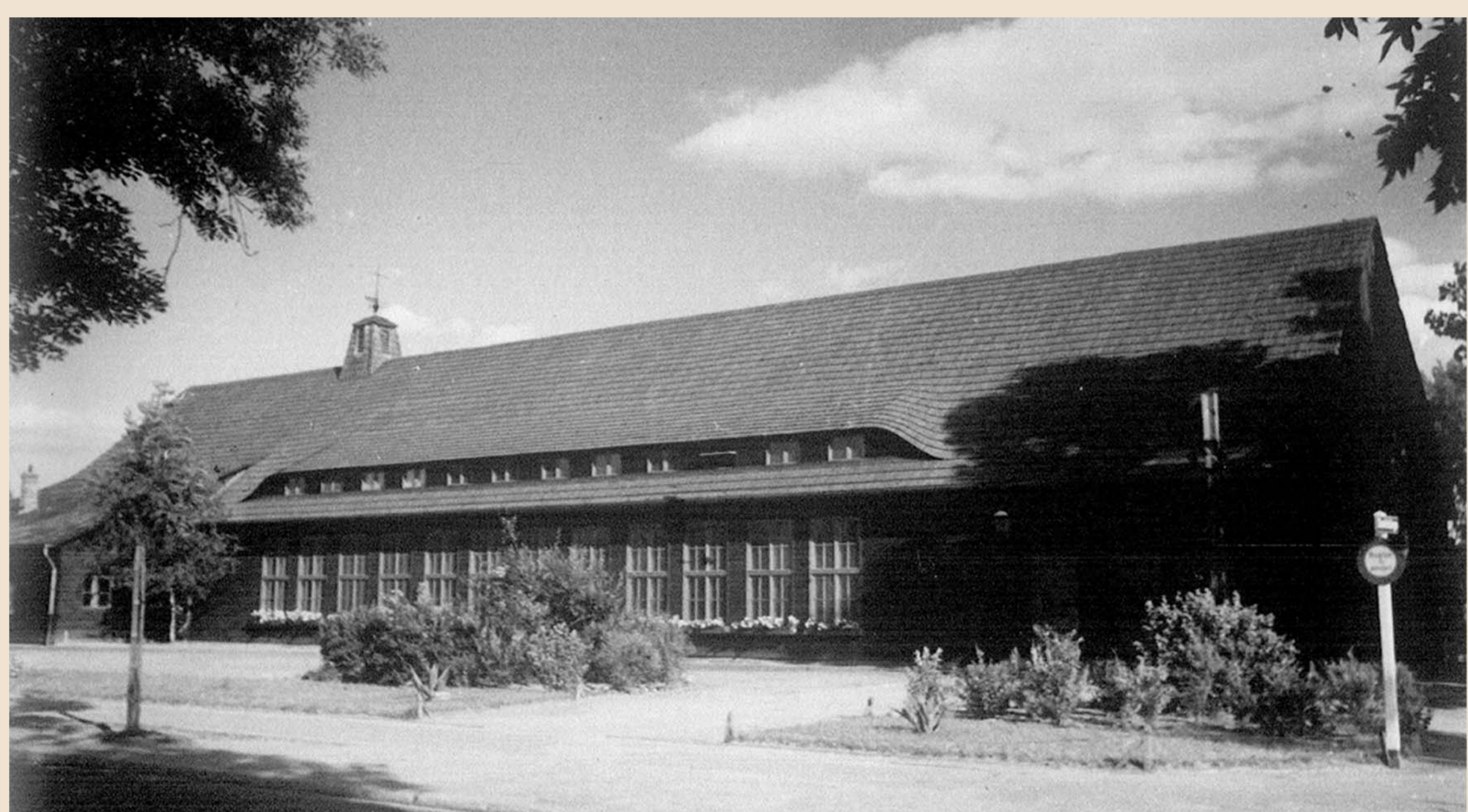
Drewniany kościół św. Jana Kantego, istniejący w latach 1946-1988