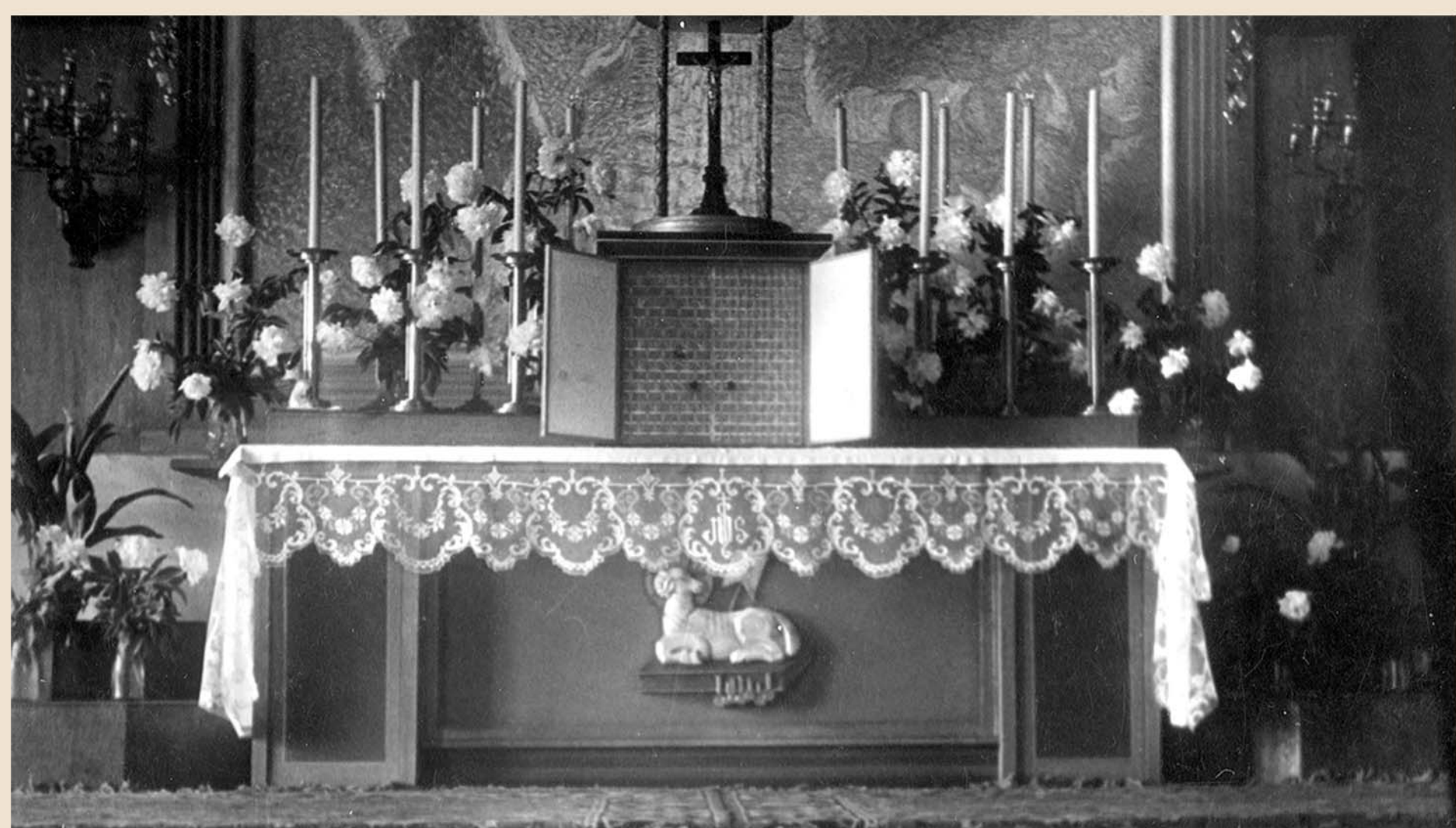
Ołtarz główny w drewnianym kościele św. Jana Kantego – około 1960 r.