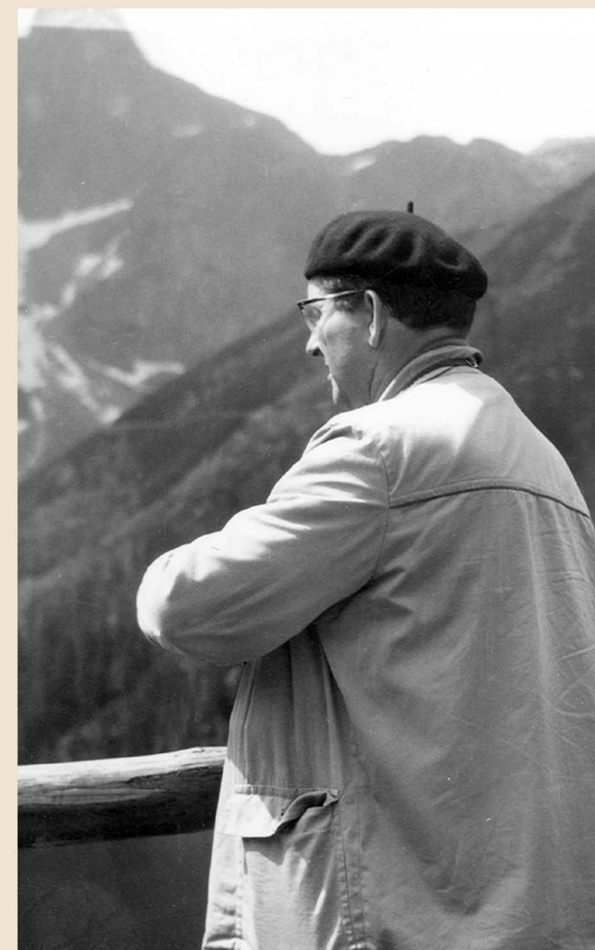
Podczas wakacji w Zakopanem w 1962 r. (lipiec) – nad Morskim Okiem