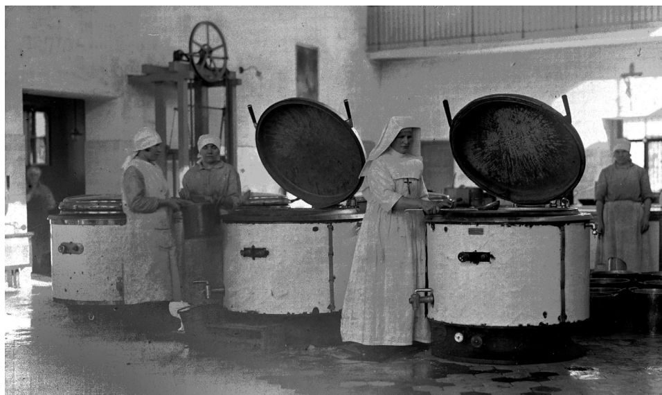
Ryc. 2. Siostra zakonna w kuchni Szpitala dla Nerwowo i Psychiczenie Chorych w Kobierzynie, 1931 r. Publikowane za zgodą Narodowego Archiwum Cyfrowego, 1-C-310-3

praktyki zawodowej 19 . Rok później Minister Opieki Społecznej utworzył rejestr pielęgniarek 20 .