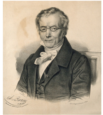
Ryc. 4. Jean-Étienne Esquirol [domena publiczna]

Objąwszy w 1825 r. posadę naczelnego lekarza zakładu dla obłąkanych w Charenton 37 , Esquirol w bardzo radykalny sposób przystąpił do realizacji zasady „alienacji” pacjentów od świata zewnętrznego, połączonej z ich „socjalizacją”: wraz z pensjonariuszami przy wspólnym stole do posiłków zasiadał personel, a także sam Esquirol i jego rodzina 38 . Wcześniej jednak, stał się inicjatorem reformy francuskiego systemu opieki nad obłąkanymi. Opracowany przez niego program zmian jednoznacznie klasyfikował zaburzenia psychiczne jako chorobowe, a dotknięte nimi osoby jako pacjentów, wymagających opieki wykwalifikowanych lekarzy. W raporcie z 1818 r. przygotowanym