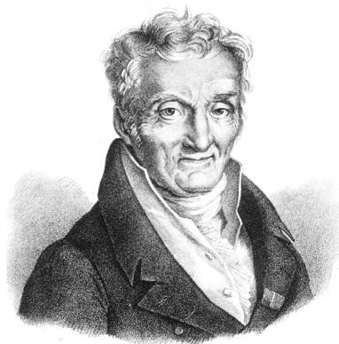
Ryc. 2. Philippe Pinel

Jeana-Baptisty Pussina (1745-1811), Pinel zrozumiał, że zachowanie pacjentów można okiełznać łagodnością, bez konieczności pętania ich łańcuchami. Zdecydował zatem o zdjęciu z obłąkanych żelaznych kajdan 25 . Podobne zarządzenie wydał następnie w Szpitalu Salpêtrière , dokąd trafił w 1795 r. 26