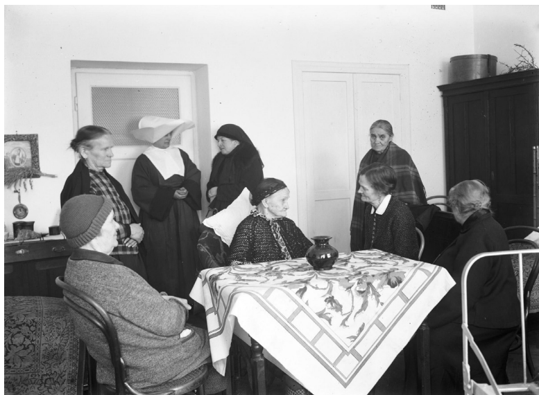
Ryc. 3. Dom opieki prowadzony przez szarytki w Krakowie, 1937 r.

Innym zgromadzeniem specjalizującym się w takiej działalności było Zgromadzenie Sióstr św. Katarzyny Dziewicy i Męczennicy. Katarzynki pełniły posługę w 17 szpitalach, z których 6 stanowiło ich własność, a także w 20 domach starców 25 . Z kolei siostry Albertynki ze Zgromadzenia Sióstr Posługujących Ubogim III Zakonu św. Franciszka pracowały m.in. w 20 przytuliskach dla bezdomnych, ubogich i domach starców i 7 innych podobnych placówkach, gdzie przebywali razem starcy i dzieci 26 .