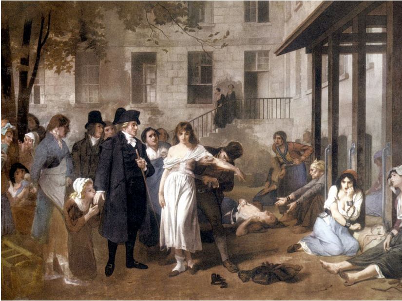
Ryc. 3. Pinel uwalniający szaleńców; mal. Tony Robert-Fleury (1837-1911)

czyniło się do utrzymania w mocy decyzji Pinela. Inną przyczyną rezygnacji z przemocy wobec obłąkanych był zmieniający się paradygmat szaleństwa: Pinel dostrzegł w nim potencjalnie uleczalną chorobę woli. Dominacja lekarza nad pensjonariuszami azylum od tej pory urzeczywistniała się w inny sposób: przede wszystkim jako moralna i intelektualna wyższość personelu medycznego nad pacjentem.