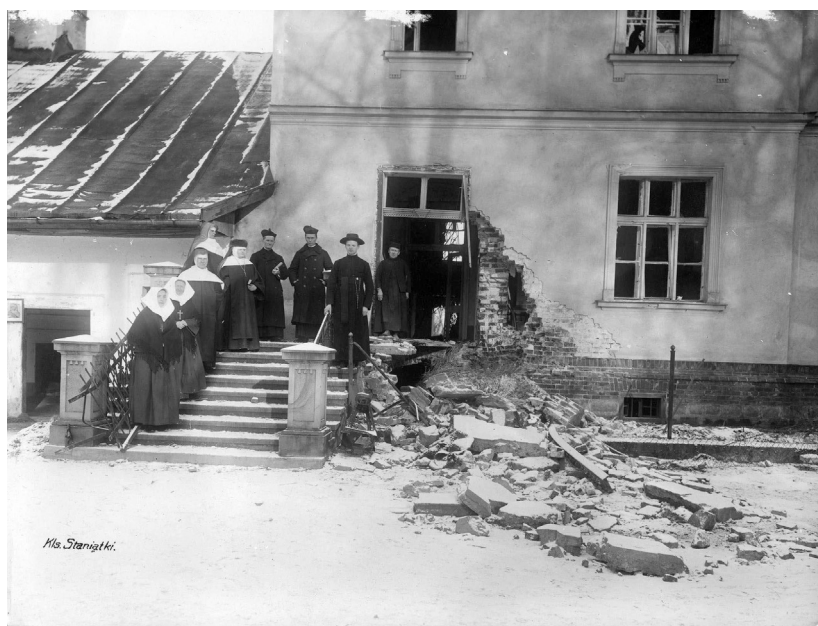
Ryc. 1. Staniętki. Zniszczenia wojenne w klasztorze Benedyktynek

i posiadłości kościelnych przeprowadzono po trzecim rozbiórce Polski. Przejęte majątki przekazano wyższym urzędnikom pruskim. Tylko w latach 1800-1806 zlikwidowano 19 domów zakonnych. W okresie wojen napoleońskich przeprowadzono kasatę klasztorów na Śląsku pruskim, by zapłacić Francji kontrybucje wojenne. Po 1815 r. Edward Flotwell, naczelny prezes Wielkiego Księstwa Poznańskiego, uczynił kasatę klasztorów, a więc i prowadzonych przez nie placówek opiekuńczych, jednym z głównych punktów programu germanizacji. Natomiast w Królestwie Polskim rozbijano struktury zakonne stopniowo. W 1832 r. została przeprowadzona wielka kasata klasztorów, w wyniku której zlikwidowano 194 domy zakonne, zamieszkałe przez mniej niż 8 zakonników, jakie znajdowały się w guberniach o małej liczbie ludności katolickiej. Najbardziej represjonowano zakony żebrzące, ponieważ utrzymywały ściśle stosunki z ludem, a to niepokoiło carat. Dopiero kasaty przeprowadzone w latach 1836-1843 dotknęły zakony zajmujące się szpitalnictwem i działalnością charytatywną; zlikwidowano wtedy m.in. 12 klasztorów bernardynów, 7 franciszkanów konwentualnych i jeden bernardynek. Wreszcie, po powstaniu styczniowym, na podstawie ukazu „O reformie klasztorów w Królestwie Polskim” przeprowadzono kasatę 129 klasztorów. Mimo wstrząsu, zakonnicy i zakonnice kontynuowali działalność w zmienionych warunkach, najczęściej angażując się w życie parafii 15 .