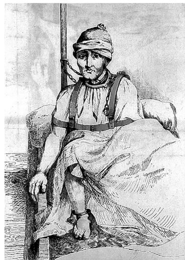
Ryc. 1. James Norris, jeden z najsławniejszych zakutych w kajdany pacjentów londyńskiego Szpitala Bedlam

Co prawda, również w opinii Battiego podstawowym i najskuteczniejszym postępowaniem wobec szaleńców miała być ich izolacja od świata, była ona jednak rozumiana jako forma terapii: odgrodzenie od źródła obłądzenia, czyli od osób, miejsc i zdarzeń prowokujących podrażnienie nerwów i wzburzenie umysłu. Wybór tego samego działania wynikał zatem z innych przesłanek, nie chodziło już bowiem o uwolnienie społeczeństwa od niechcianego ciężaru, ale o realną pomoc cierpiącym. Battie postulował ponadto, aby w relacjach z obłąkanymi zaniechać przemocy. Dwie dekady później działania zbliżone do rozwiązań Battiego podjął włoski medyk Vincenzo Chiarugi (1759-1820), w lecznicy Św. Doroty we Florencji uwalniając szaleńców z łańcuchów 22 . Chiarugi nie zrezygnował jednak z izolacji